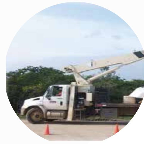
NATIONAL 500E 2

Camión Titán Alcance máximo: 30 mts. Capacidad: 23 ton.